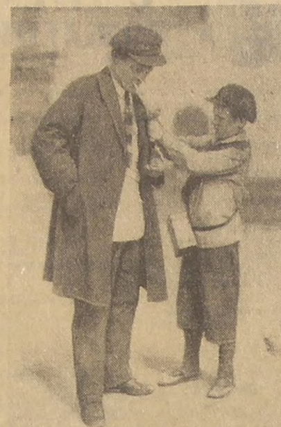
Мальчишки и девочки в красных галстуках останавливали на улицах прохожих и просили помочь голодающим детям. Не одна пара босых ног была обута на эти деньги. И не один десяток голодных ртов на эти деньги был накормлен.

В трудное время родилась пионерская организация. Страна переживала последствия войны. Сколько было тогда голодных и чужаков, лишенных крова ребятшек! Партия решила покончить с беспризорностью. Могли ли быть в стороне от этого важного дела пионеры? Конечно, нет.