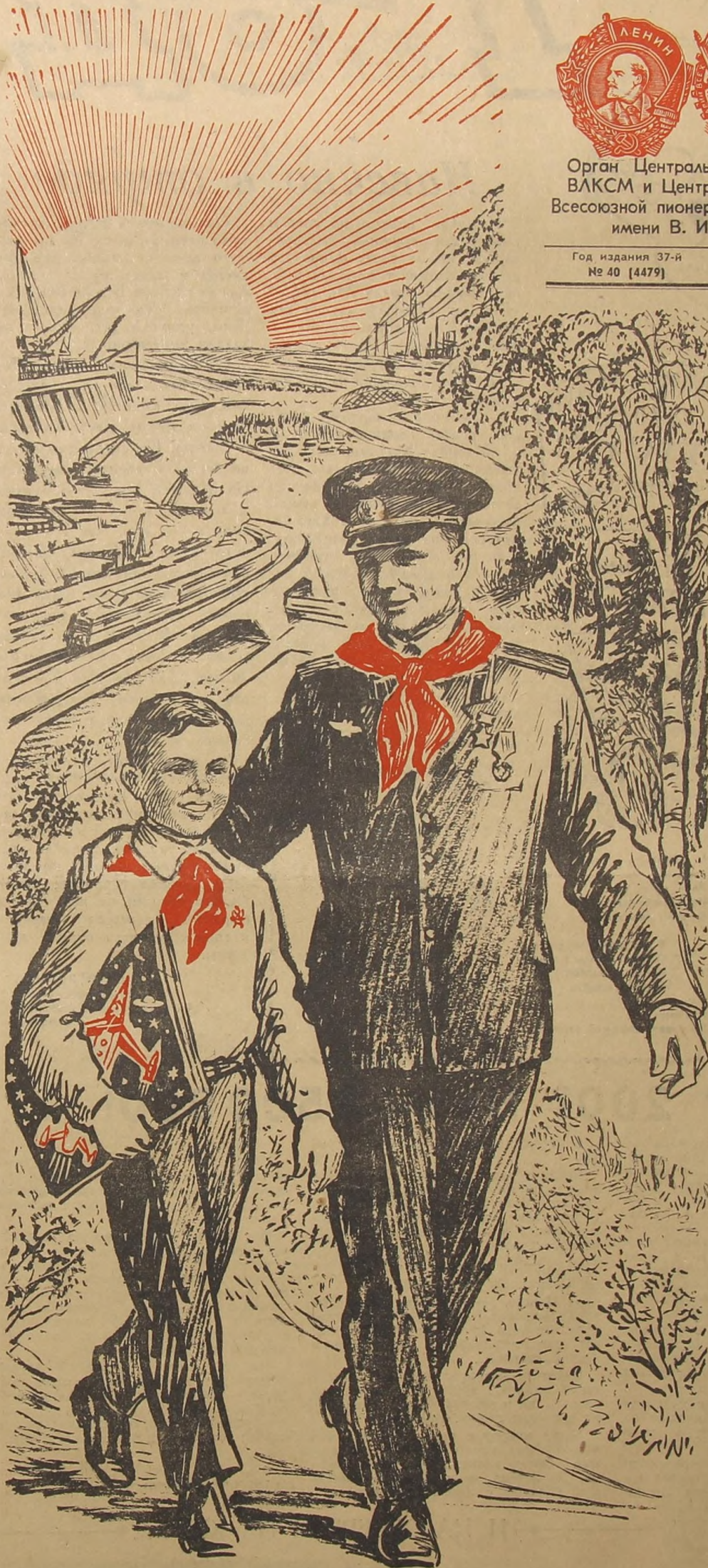
Рис. Л. СМЕХОВА.

Юный ленинец растёт крылатым, Затаив отважную мечту — Он мечтает вслед за старшим братом Одолеть любую высоту. Будет он к созвездьям уноситься, Направлять во мраке корабли,