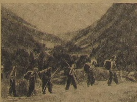
С севера на юг, с запада на восток пролегли дороги Всесоюзной экспедиции пионеров и школьников. В ней участвует около 5 миллионов человек.

НА СНИМКАХ: туристы Камчатки и Кабардино-Балкарской АССР.