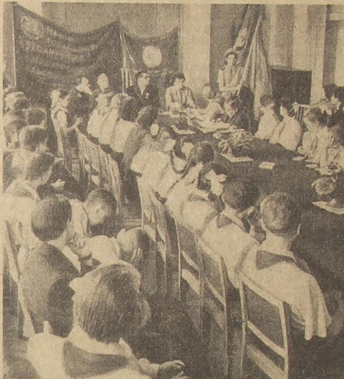
Встреча в «Пионерской правде». С волнением слушают все историю боевого знамени.

Многие боевые знамена переданы в ваши руки, пионеры! Изучайте их историю. Тепло поздравил ребят с праздником