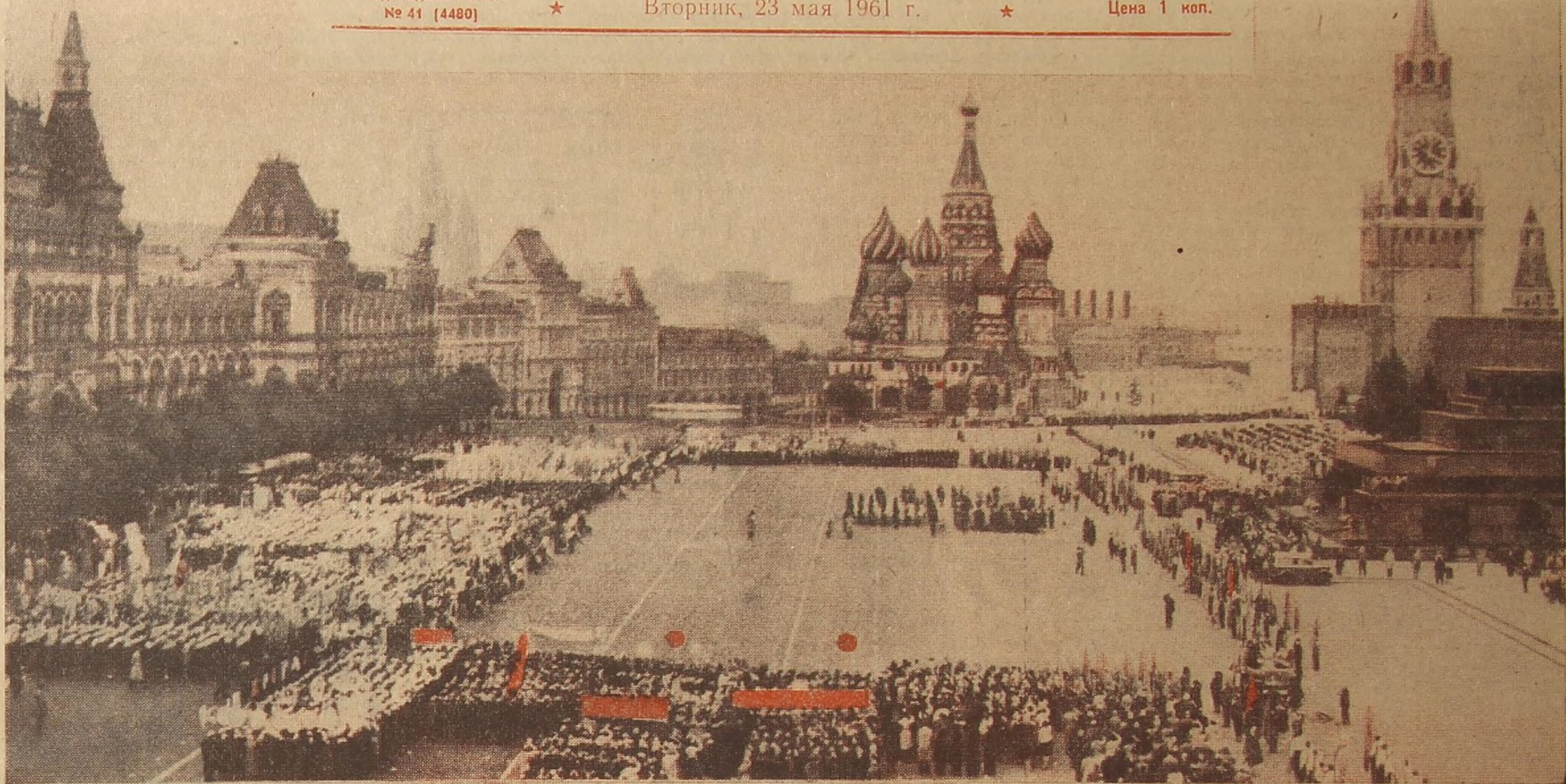
В этот день Красная площадь была пионерской. Отрядам «Спутникам семилетки» выпала честь почётным строем встать у Мавзолея. Это лучшие наши ребята — гордость столицы. А вот там, справа, построились знаменосцы со своими славными знаменами. Сейчас начнётся парад!