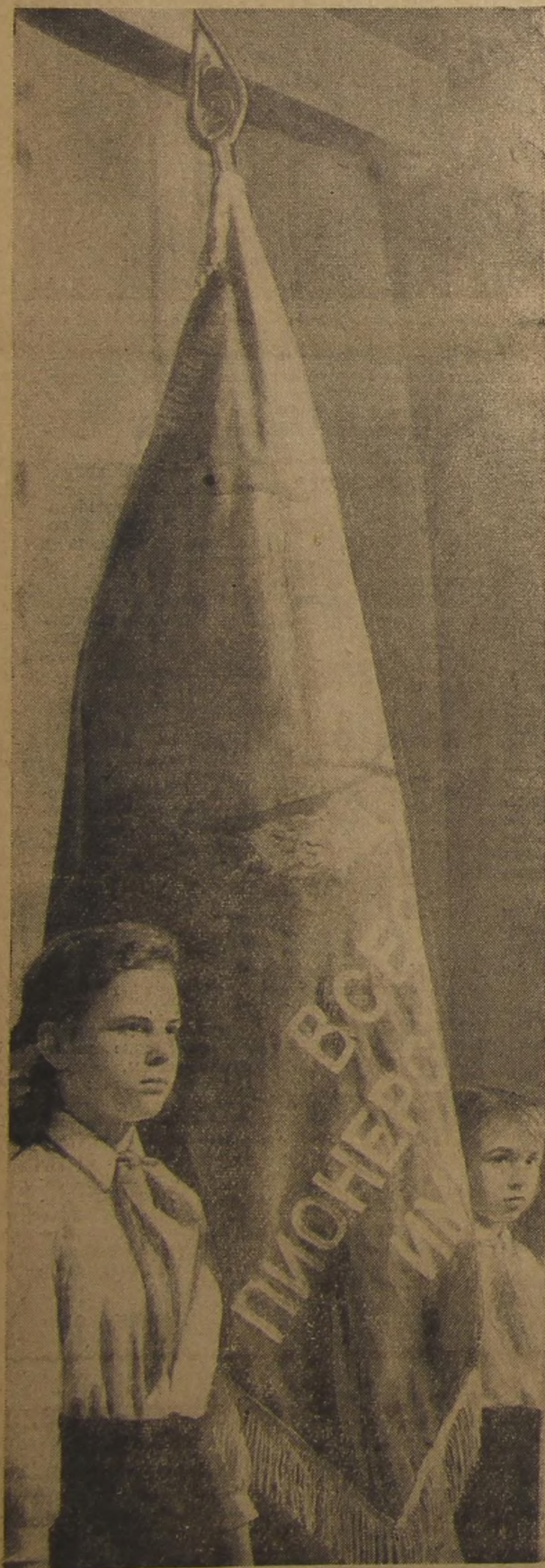
В почётном карауле.