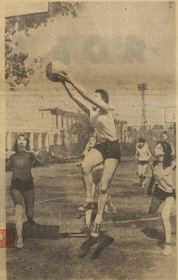
Ещё мгновение — и мяч в корзине. Хорошо играли баскетболистки 2-й школы города Капсукаса и победили.