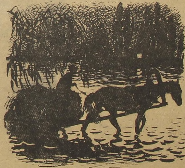
Рис. Н. УСТИНОВА.