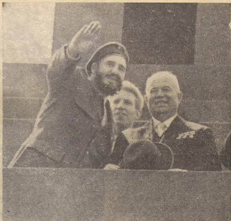
На трибуне Мавзолея Никита Сергеевич Хрущёв и Фидель Кастро.