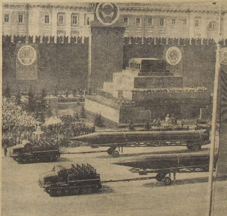
Двигается боевая техника.