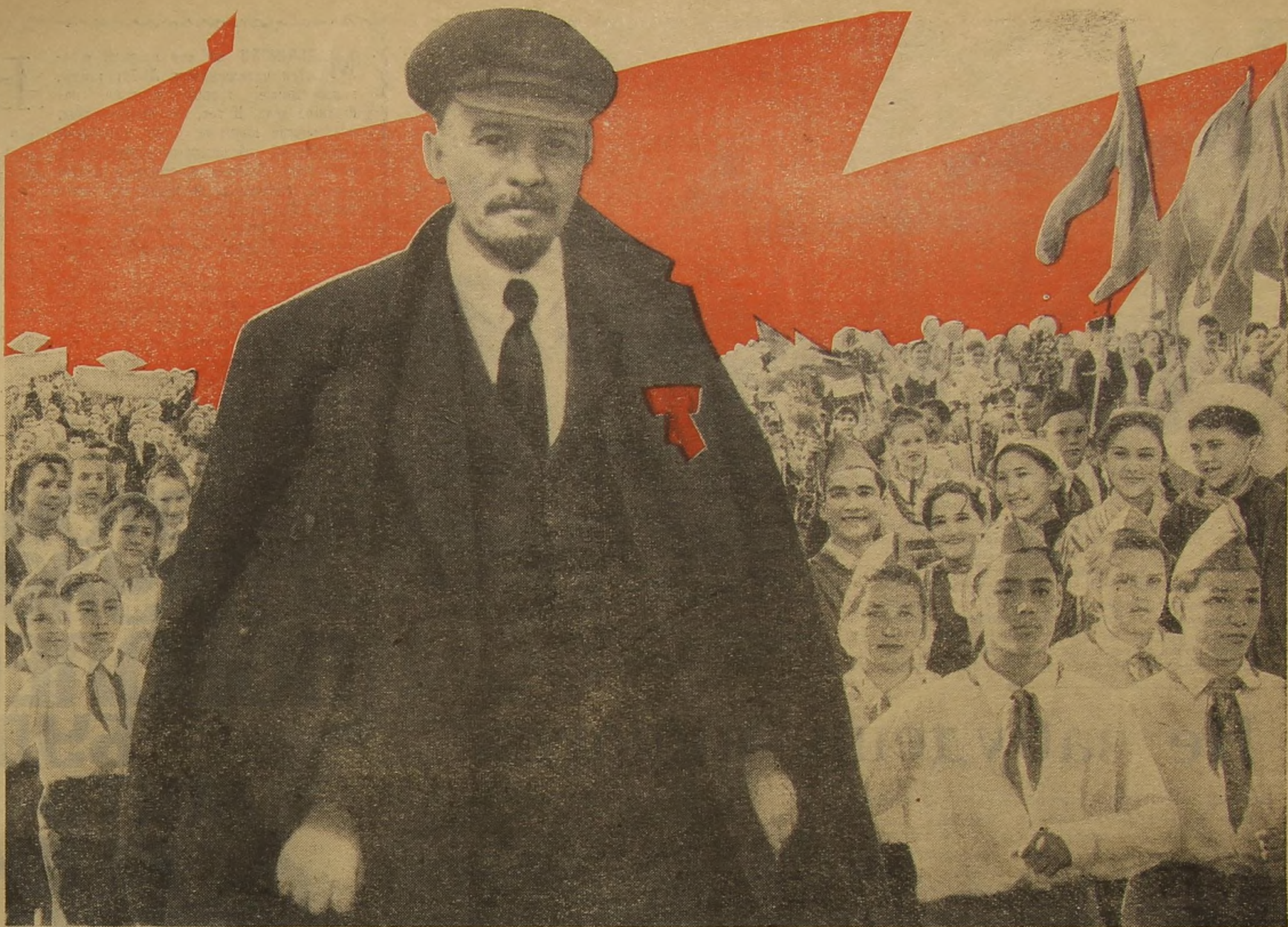
Плакат В. АНДРЕЕВА.