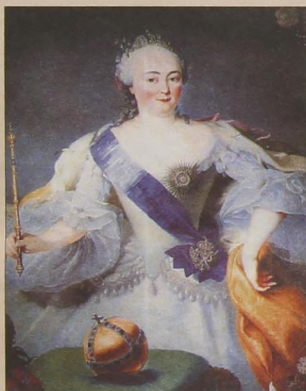
Императрица Елизавета Петровна (1741 — 1761 гг.). Художник Гаспар Георг Пренер.

Её-то, новую крепостную стену, и поручили возводить мастеру-гороододедцу Фёдору Коню. Сам царь Фёдор Иоаннович и его боярин Борис Годунов торопили Фёдора Коня: очень нужна была эта стена. Тут по царскому повелению собрали множество работных людей, привезли строительных материалов в избытке. Только как ни торопились, всё равно завершились работы через восемь лет. Зато же и была эта