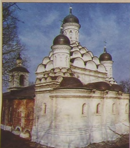
Церковь Живоначальной Троицы в царском селе Хорошёве. 1598 год. Зодчий Фёдор Конь.

ним юношей, когда на Москву напал жестокий крымский хан Девлет-Гирей. Случилось это в 1571 году (по современному летоисчислению). Крымчаки застали врасплох опричное войско Ивана Грозного и подожгли Москву. Пожар был так силен, что даже хан Девлет-