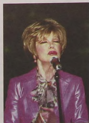
Подарок от Людмилы Гурченко — песня.

ле, своём классе. Признание жюри — это почётно. Однако важнее признание тех, кого учишь. Стоит только представить, как победителей принимали на следующий день в классах!