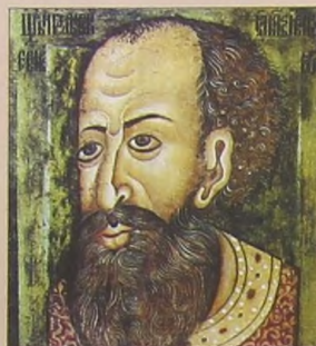
Иван IV. Копия с портрета, хранящегося в Копенгагене.

А в Москве Фёдора помнили и ждали: вот-вот объявится и примется вновь