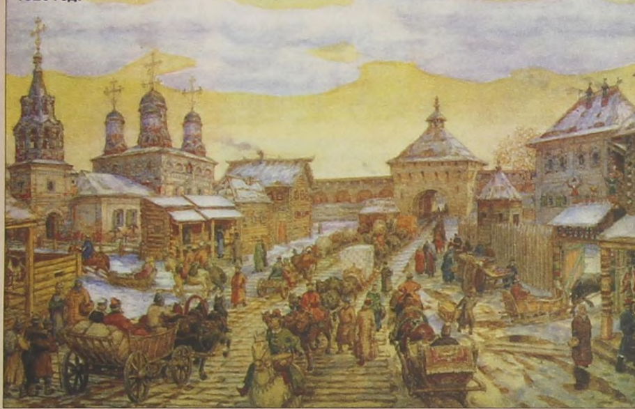
У Мясницких ворот Белого города. Художник А. Васнецов. 1926 год.

Не сохранилась стена. Но всё же след горододедца Фёдора Коня в Москве остался. Это церковь Живоначальной Троицы в Хорошёве и церковь Донской Божьей Матери (Малый собор) в Донском монастыре. Но, конечно, самая высокая память о талантливом зодчем древности — это ещё одна кре-