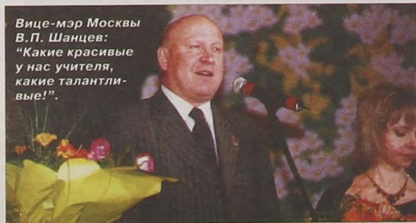
Вице-мэр Москвы В.П. Шанцев: "Какие красивые у нас учителя, какие талантливые!"

Школьник военной поры актёр Алексей Баталов: "Я преклоняюсь перед профессией учителя".