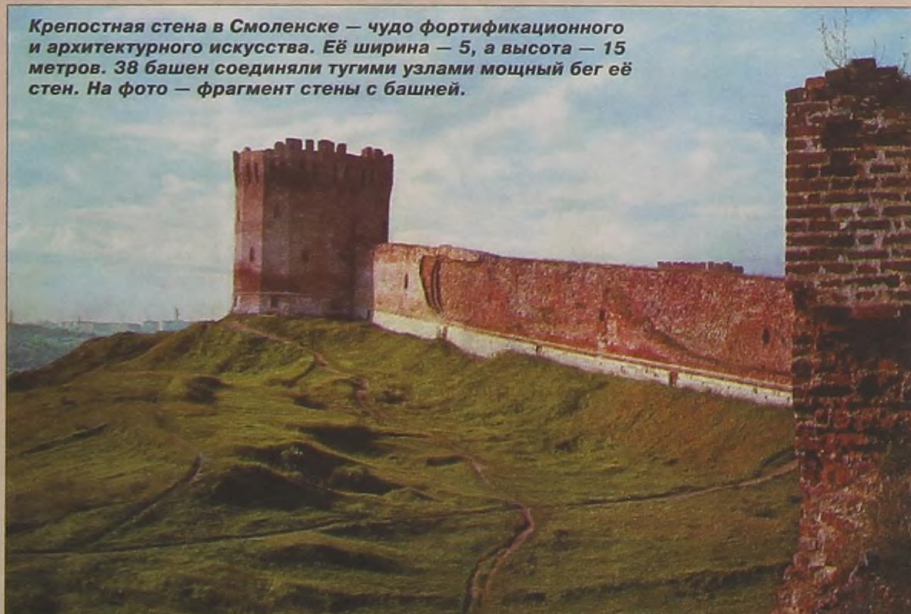
Крепостная стена в Смоленске — чудо фортификационного и архитектурного искусства. Её ширина — 5, а высота — 15 метров. 38 башен соединяли тугими узлами мощный бег её стен. На фото — фрагмент стены с башней.

крепостная стена превелика и премошна: около десяти километров длины, высотой как трёхэтажный дом, то есть почти десять метров и почти шестиметровой толщины. Тут могли три трой-