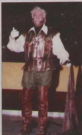
Дон Кихот (знаменитый артист Владимир Зельдин) сошёл со страниц книжки из школьной библиотеки и пришёл приветствовать конкурсантов.