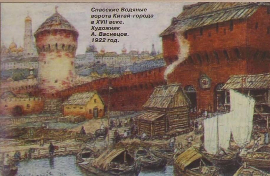
Спасские Водяные ворота Китай-города в XVII веке. Художник А. Васнецов. 1922 год.

пость, которую возвёл Фёдор Конь, — Кремль города Смоленска. Эту крепость он возводил в 1595 — 1602 годах. И тоже кстати. Кто только не стремился завоевать Русское государство! Но всякий раз на пути неприятеля вставали мощные крепостные стены, построенные Фёдором Савельевичем Конём.