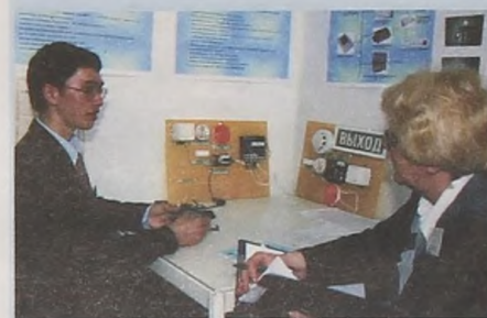
И. Никитин, Тюмень. Пожарная сигнализация. Лучшая работа в области чрезвычайных ситуаций.