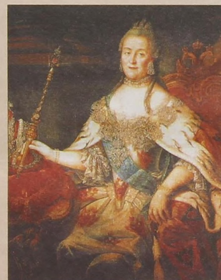
Императрица Екатерина II (1762 — 1796 гг.). Художник А. П. Антропов.

ки разъехаться. Над всюю же стеной по всей её длине возвышались 27 грозных башен, каждая оснащена литыми пушками.