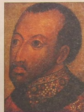
Царь Фёдор Иоаннович. Парсуна. Конец XVI — начало XVII в.

Назвали эту мощную стену стеной Белого города. Может быть, потому, что она была побелена, или потому, что за стеной поселились служилые люди, свободные от некоторых податей и налогов. Таких служилых лю-