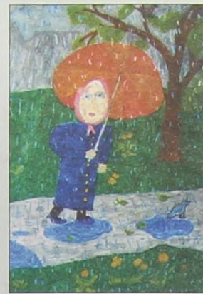
“Бабушка под зонтиком”.