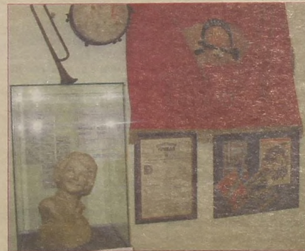
В экспозиции выставки — «Пионерка» скульптора Иннокентия Жукова, первый номер «Пионерской правды», горн, барабан...

Мы все счастливые люди, потому что прошли пионерку, комсомол. И стремились быть полезными своей стране. Сердечно поздравляю с наступающим 90-летием Пионерии и желаю всем неукротимой, творческой пионерской энергии.