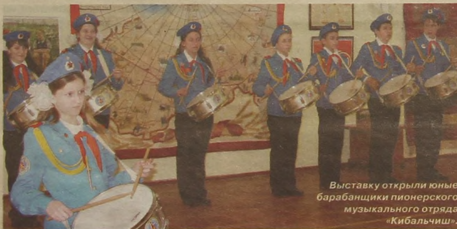
Выставку открыли юные барабанщики пионерского музыкального отряда «Кибальчиш».

люди, меняется страна. Но неизбежно требование к каждому человеку — быть патриотом и быть гражданином.