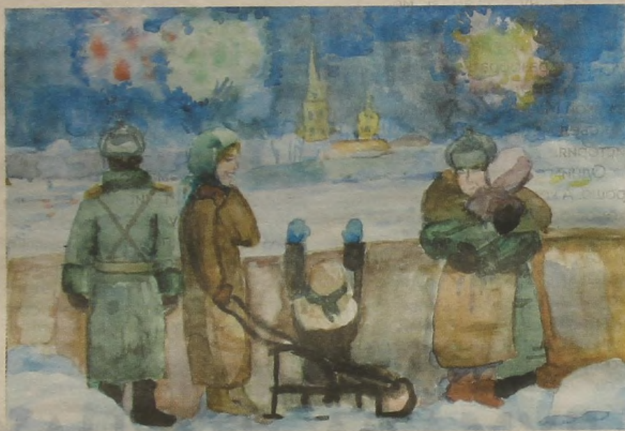
«27 января». Рис. Наташи БАЛАЖ, 10 лет

«Сим-сим, откройся!» Это заклинание произносят, когда хотят проникнуть в неведомое: в таинственную пещеру или в жгучие тайны прошлого — другими словами, в сокровищницу. Надо просто отворить музейную дверь, врубиться в толщу эпох и произнести: «Сим-сим, откройся!»