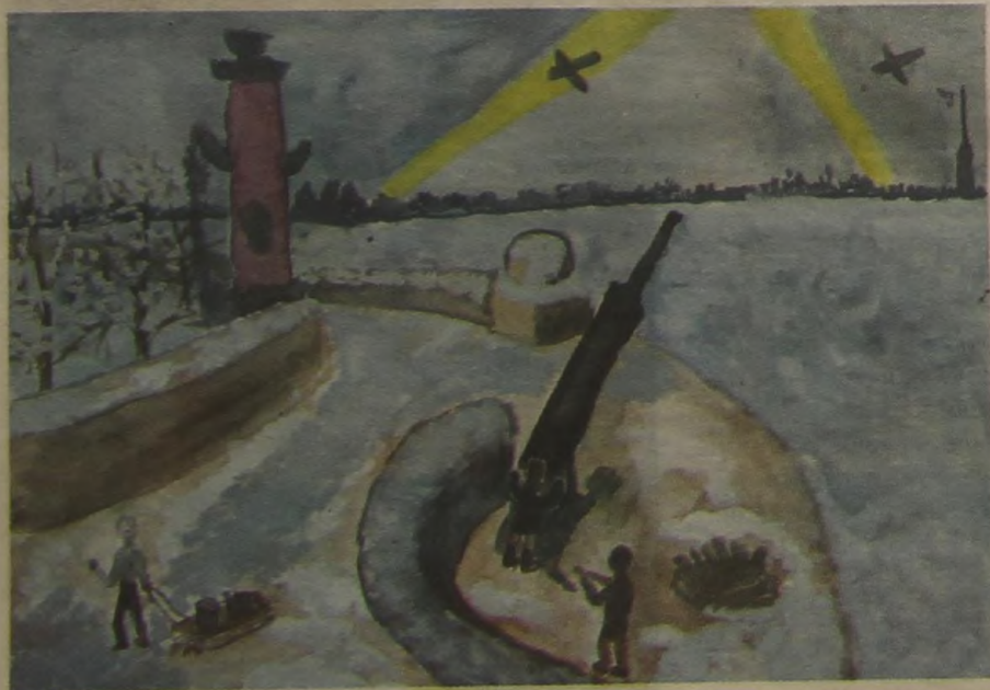
«Блокада Ленинграда». Рис. Олега ТУРОБИНСКОГО, 10 лет

Татьяна КУДРЯВЦЕВА, редактор по Санкт-Петербургу. Рисунки воспитанников Изостудии Школьного центра Эрмитажа, руководитель Борис КРАВЧУНАС