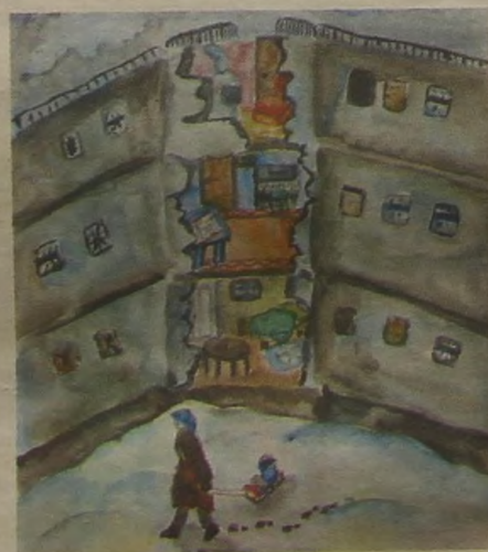
«Разрушенный дом в блокаду». Рис. Полины ШКОЛЯРЕНКО, 9 лет