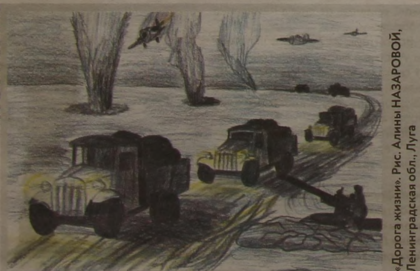
«Дорога жизни». Рис. Алины НАЗАРОВОЙ, Ленинградская обл., Луга