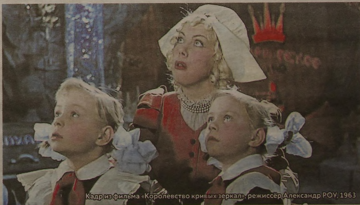
Кадр из фильма «Королевство кривых зеркал», режиссёр Александр РОУ, 1963

Мне понравились Аксал, Гурд, сама Оля и, как ни странно, немножечко Нушрок — только его внешность, его описание.